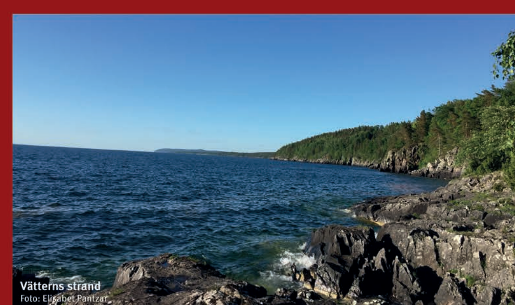
Vätterns strand