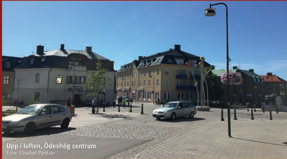
Upp i luften, Ödeshög centrum