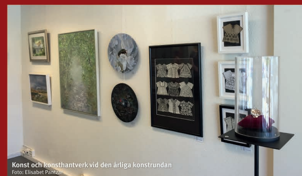
Konst och konstantverk vid den ärliga konstnärinnan