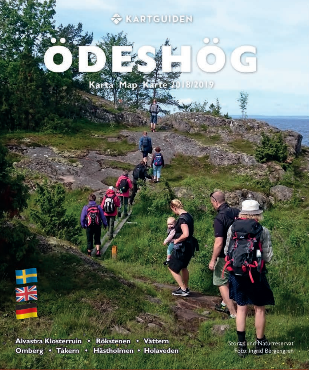
Alvstra Klosteruin • Rökstenen • Vättern Omberg • Tåkern • Hästholmen • Holaveden Stora Lunds Naturreservat