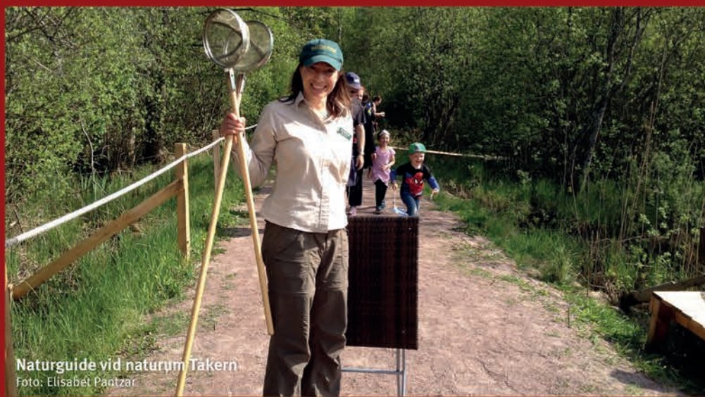
Naturguide vid naturum Tåkern