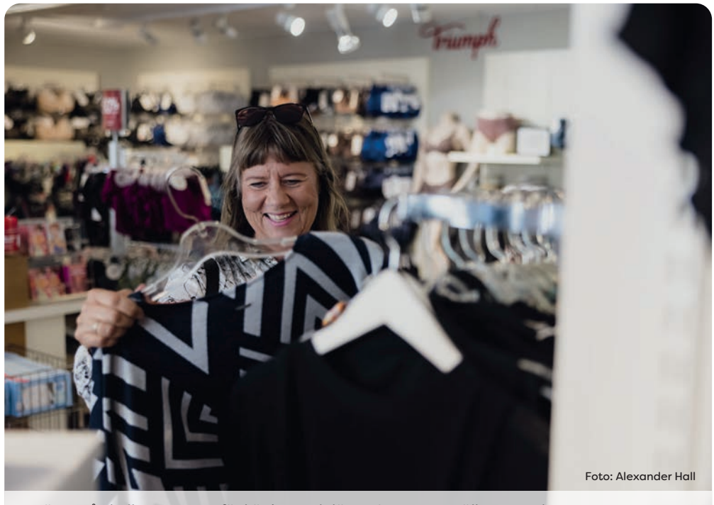
I Mönsterås kallas centrum för köping, och längs Storgatan välkomnas du av små butiker med personlig service i en gemytlig miljö.