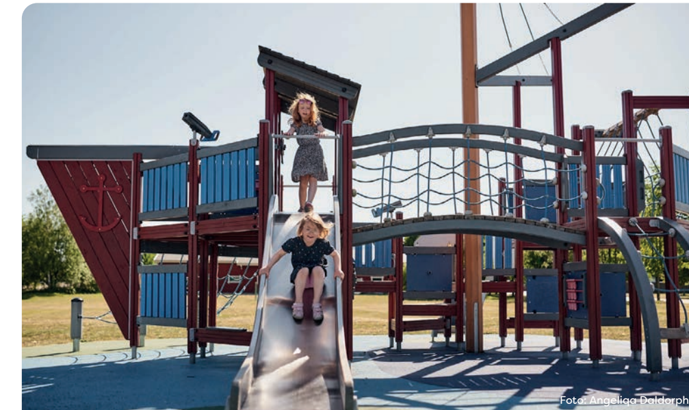
I kommunen finns ett trettiotal allmänna kommunala lekplatser, som erbjuder en bra variation av lek för olika åldrar. En större lekplats och aktivitetspark hittar du i hamnen i Mönsterås.