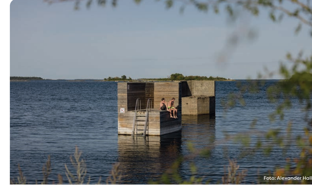
Mönsterås kommun har många fina badplatser. Det gamla färjeläget på Oknö har byggts om och är nu ett populärt och lite annorlunda havsbad på djupt vatten.