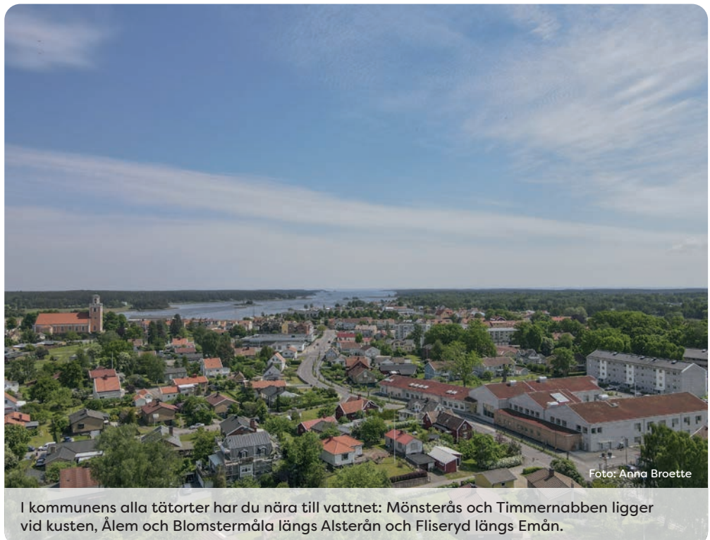
I kommunens alla tätorter har du nära till vattnet: Mönsterås och Timmernabben ligger vid kusten, Ålem och Blomstermåla längs Alsterån och Fliseryd längs Erån.