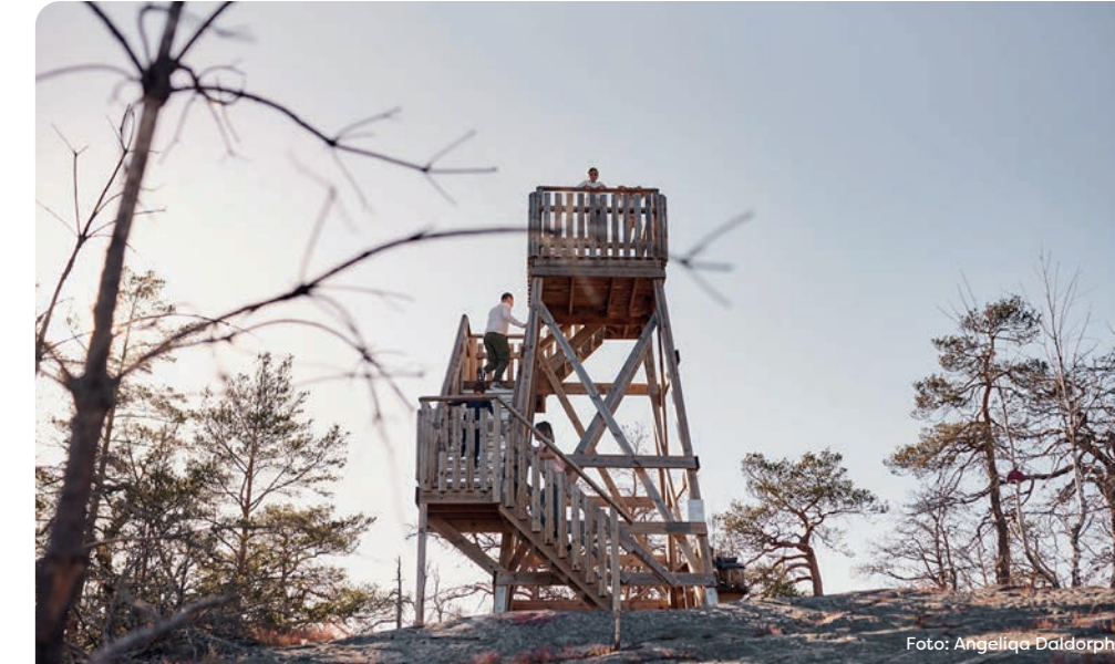
Vandringsleden vid Kevershäll kantas av troll och är ett populärt utflyktsmål. På toppen av berget kan du se Öland, flera kyrkor och Aboda Klint i sydväst.