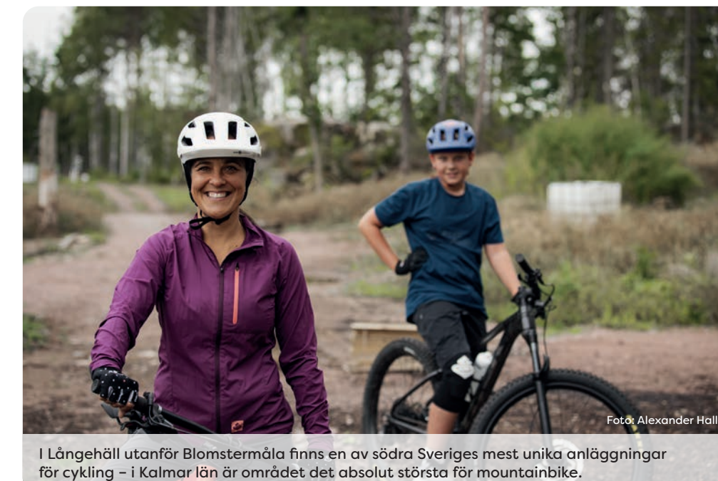
I Långehäll utanför Blomstermåla finns en av Södra Sveriges mest unika anläggningar för cykling - i Kalmar län är området det absolut största för mountainbike.