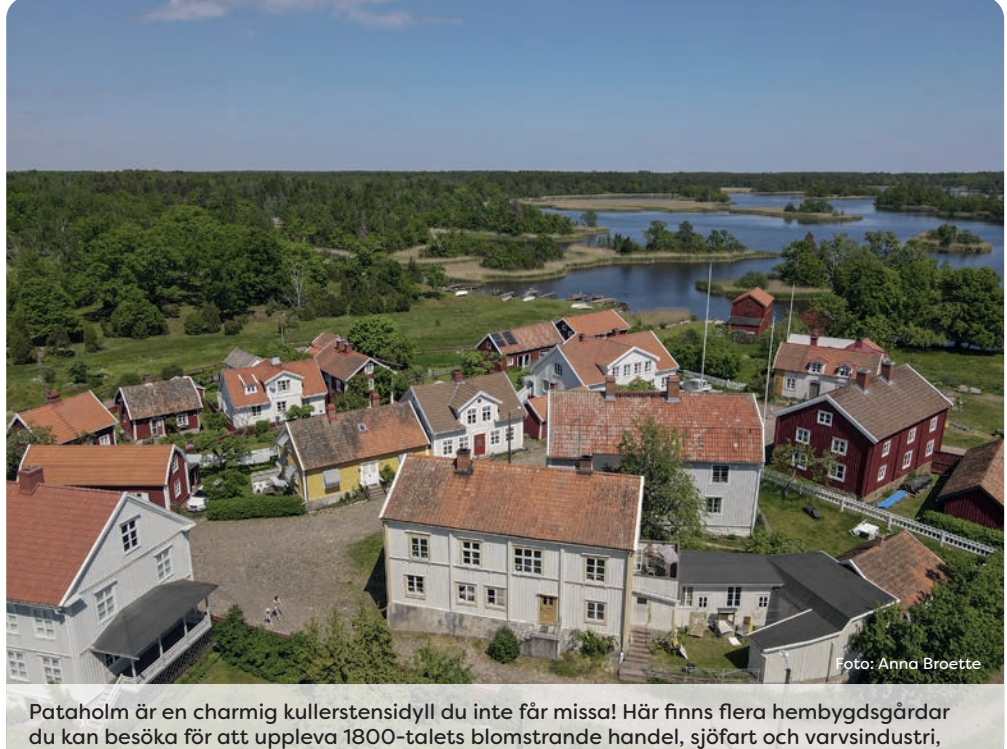
Pataholm är en charmig kullerstensidyll du inte får missa! Här finns flera hembygdsgårdar du kan besöka för att uppleva 1800-talets blomstrande handel, sjöfart och varvsindustri.