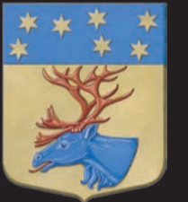
Arvidsjaur kommun Arvidsjaur kommun

www.arvidsjaur.se • www.visitarvidsjaur.se